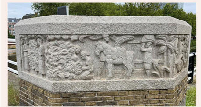
Reliëf op de Javabrug uit 1950/1951.